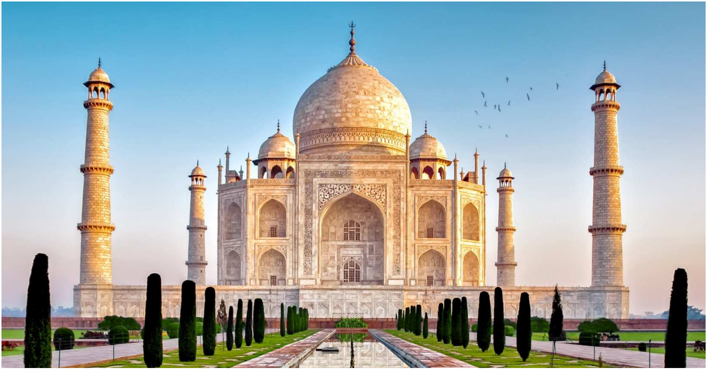
Taj Mahal, Delhi