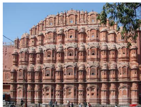
Palast der Winde